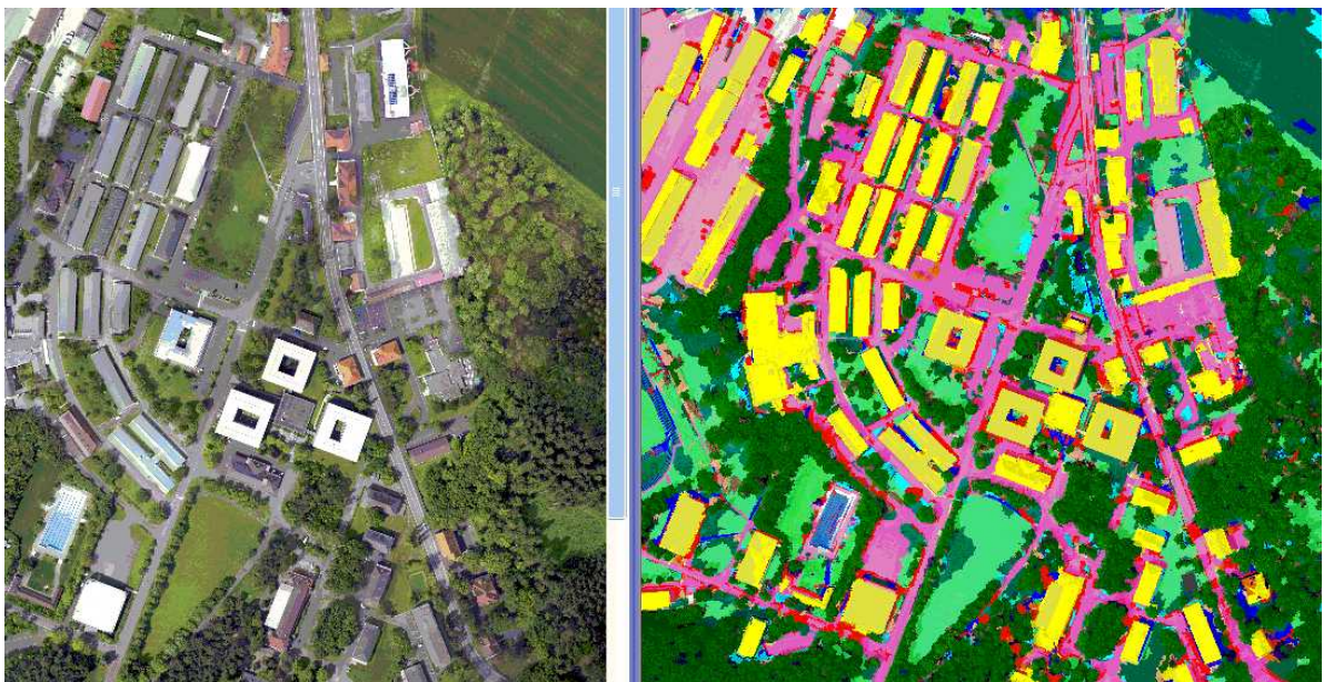
Abb. 4: Bild links: Orthophoto. Bild rechts: Auswertungsergebnis. Automatische Trennung von Vegetation (grüne Bereiche), vegetationsloser Flächen (lila) und Dachflächen (gelb) anhand von Laserdaten und Luftbildern. Das vollständige Beispiel finden Sie auch unter: http://www.landconsult.de/home/innovation/innovations.asp#4de

Die Abbildungen 1 bis 3 können auch über Google Earth visualisiert werden, indem sie im Webbrowser über die Adresse http://www.landconsult.de/home/innovation/innovations.asp#2de den Link „Fallbeispiel in Google Earth öffnen“ anklicken.